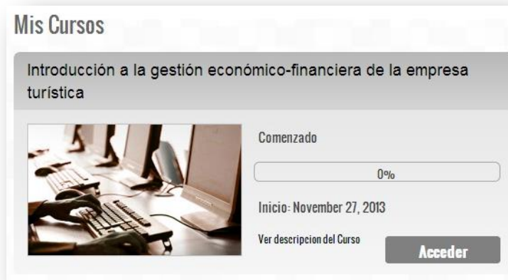
Figura 5: Mis cursos

Por cada curso se muestran los siguientes elementos: