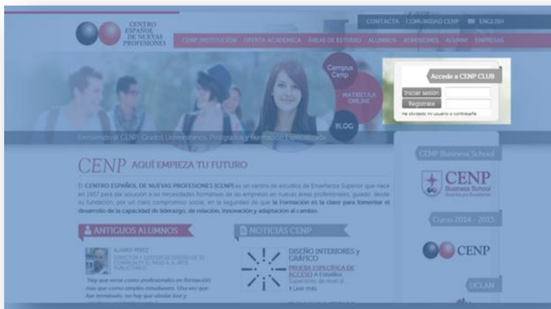
Figura 1: Acceso