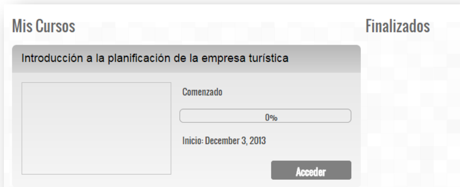
Figura 4: Secciones de la Plataforma

Este área se divide en dos secciones: Mis cursos y Finalizados .