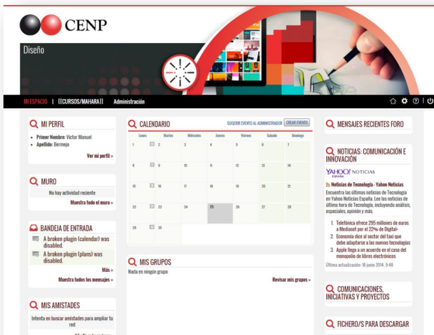
Figura 2: Página principal

Para acceder a la sección de cursos, pulsa sobre Mis cursos → Plataforma CENP .