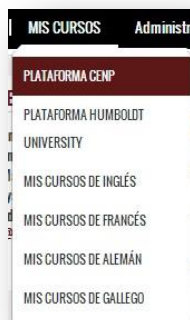
Figura 3: Acceso a plataforma CENP

Para acceder a la sección de cursos, pulsa sobre Mis cursos → Plataforma CENP .